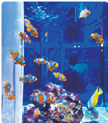
校舎入り口のロビー