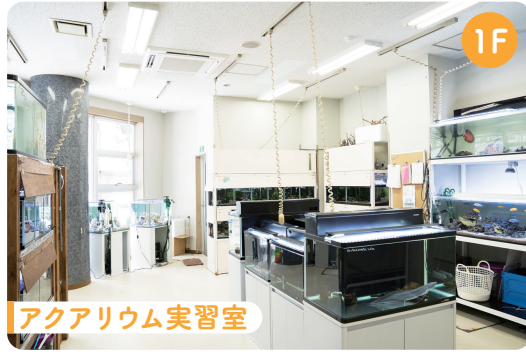
アクアリウム実習室

ウサギやインコなどたくさんの鳥や小動物を飼育しています。またオウムやミーアキャットなどの珍しい生き物も飼育しており、動物の扱い方や飼育管理方法、ペット用品についても学べます。