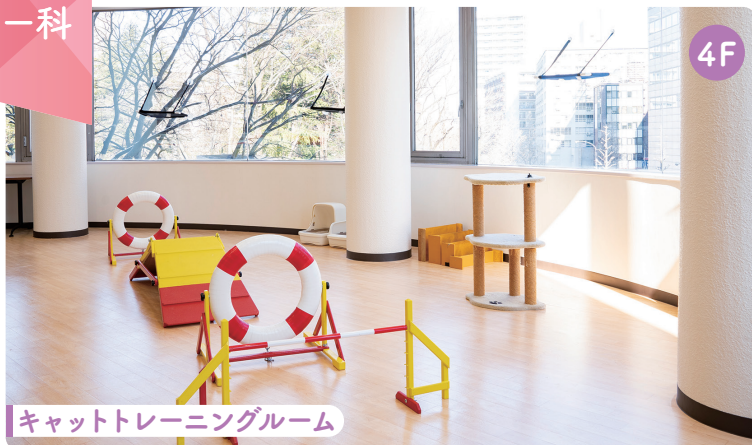
キャットトレーニングルーム

猫がストレスを感じず運動できるキャットタワーやキャットウォークを取り入れた、広々とした教室で勉強ができます。授業では、さまざまな猫種と触れ合えます。