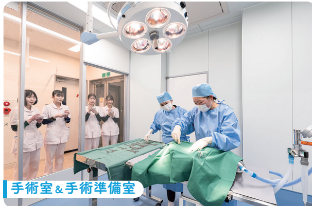
手術室&手術準備室

手術器具の準備やガウンテクニックについて学び、実際の手術を見学し手術の流れを学ぶことができます。