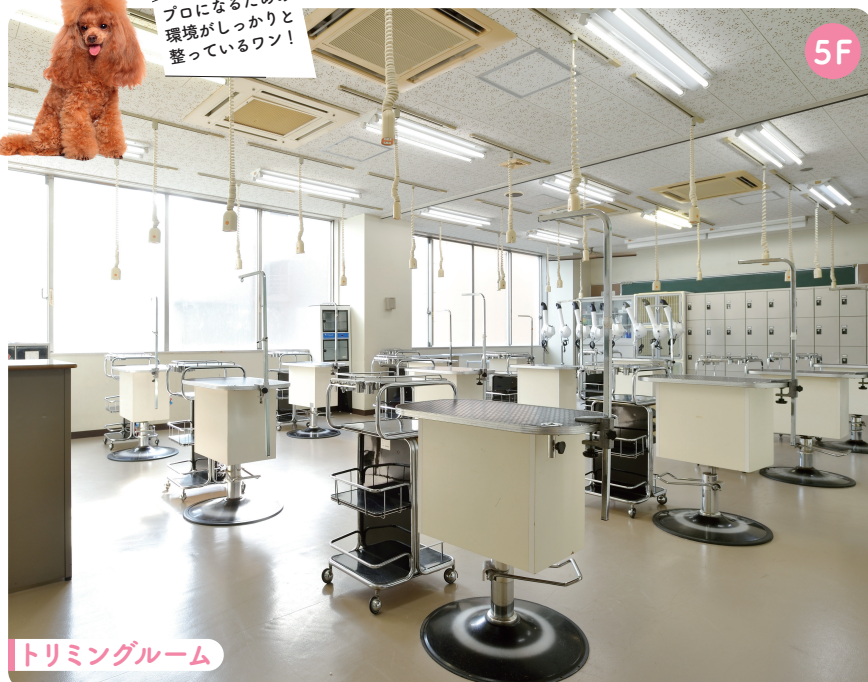
トリミングルーム