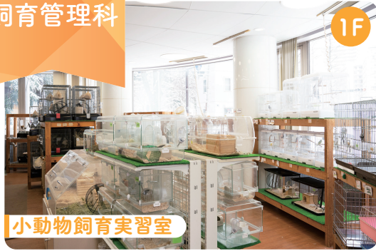
小動物飼育実習室

ウサギやインコなどたくさんの鳥や小動物を飼育しています。またオウムやミーアキャットなどの珍しい生き物も飼育しており、動物の扱い方や飼育管理方法、ペット用品についても学べます。