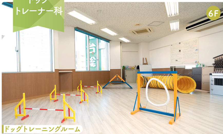
ドッグトレーニングルーム