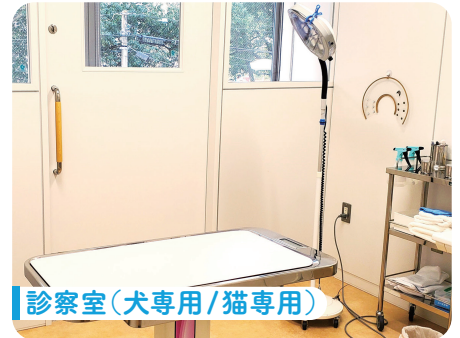
診察室(犬専用/猫専用)

犬・猫それぞれで専用の診察室があり、学生は実際に診察している様子を見学できます。