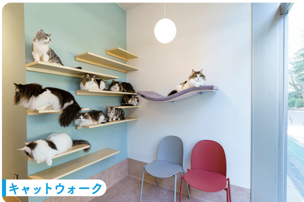
キャットウォーク